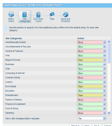
Der bedienerfreundliche Assistent sorgt für einfachstes Richtlinien-Management